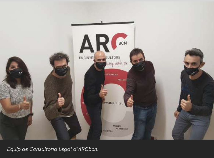
Equip de Consultoria Legal d'ARCbcn.

El PDL requereix sempre d'una consultoria especialitzada en normativa ambiental (focus emissors, residus, abocaments, accessibilitat, urbanisme...) i en normativa de seguretat i protecció contra incendis. Cal tenir uns alts coneixements en la normativa i una àmplia experiència a l'hora de proposar actuacions que s'adeqüin a normativa, pactades amb l'administració, amb mínima afectació a l'usuari. Sempre tenint en compte que el cost sigui el més contingut possible.