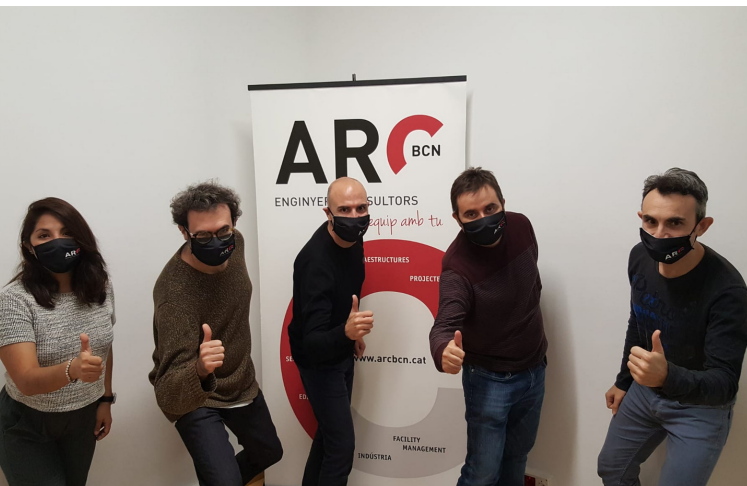
Equip de Consultoria Legal d'ARCbcn.

El PDL requereix sempre d'una consultoria especialitzada en normativa ambiental (focus emissors, residus, abocaments, accessibilitat, urbanisme...) i en normativa de seguretat i protecció contra incendis , doncs cal tenir uns alts coneixements en la densa i diversa normativa i gran experiència alhora de proposar actuacions que s'adeqüin a normativa, pactades amb l'administració, amb mínima afectació a l'usuari i que els cost sigui el mes contingut possible.